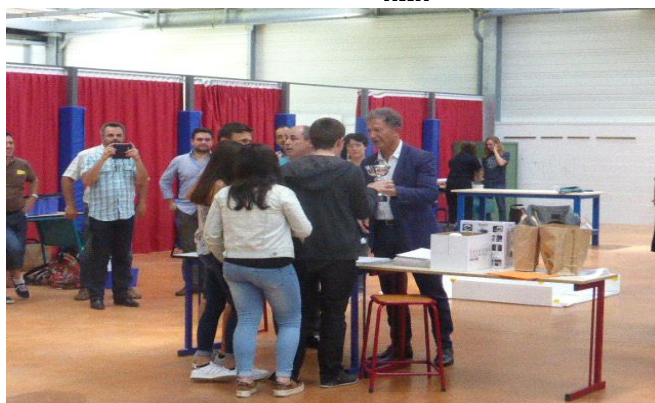
Remise du Trophée AFDET au collège François Mauriac de Sainte-Eulalie