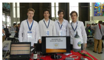
1er Prix remis par l'UPSTI : « Le système BeerTech » – Lycée français de Madrid

La cérémonie de remise des prix a rassemblé les 300 lycéens et leurs professeurs, ainsi que les nombreux partenaires industriels de l'UPSTI. Tous ont rendu hommage aux élèves, à leur capacité d'innovation et aux projets exceptionnels qu'ils ont présentés.