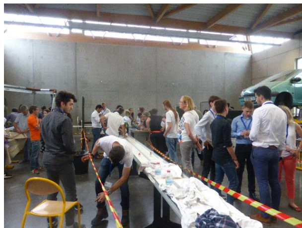
les épreuves sur piste