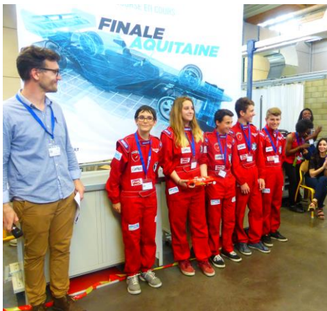
« Team Mac Queen » vainqueur de la finale

3 ème prix : HUNT TIME , Lycée Charles Renouvier, Académie de Montpellier