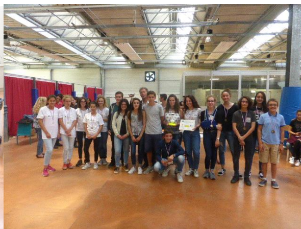
Les élèves des 3 collèges lauréats