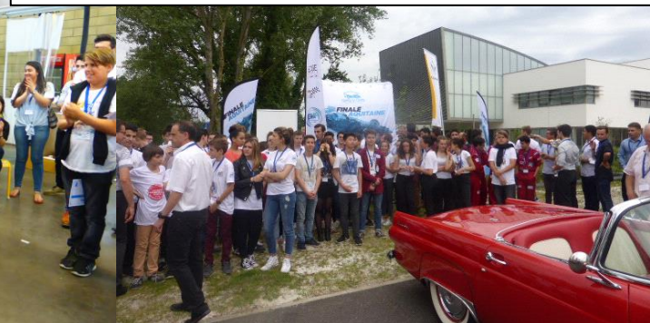
une partie des participants