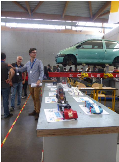
Présentation des prototypes