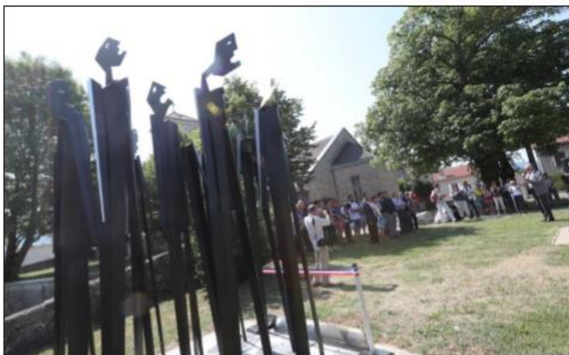
Les œuvres métalliques ornent le parvis du musée de la Résistance.