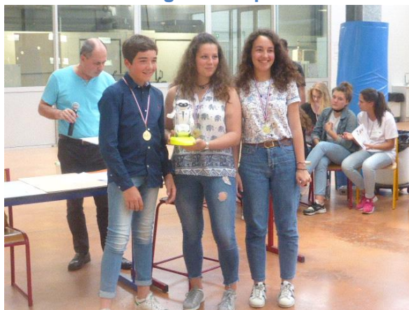
Équipe « NAM » collège Camille-Claudé, Latresne, vainqueur du Challenge robotique 2017