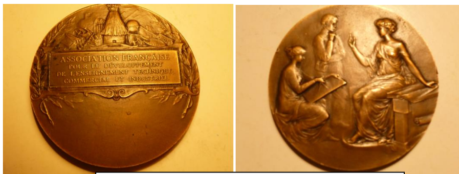
La médaille, copie d'une médaille Afdet du début des années 1900, représente la déesse Istya, laquelle symbolise le savoir et la connaissance devant deux élèves de l'industrie et du commerce.

l'Association et des missions de promotion des enseignements technologiques et professionnels en formation initiale ou continue et de contribution à l'information, à l'orientation et à l'insertion professionnelle des jeunes.