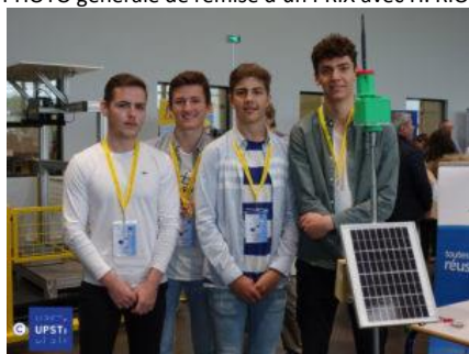
1 er PRIX ( S-SI-Lycée Bernard Palissy- SAINTES, Académie de Poitiers ) : Wildlandfire protection Ce projet permet d'améliorer la lutte anti-incendie en « zones blanches »