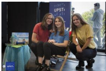
3 ème PRIX ( S-SI -Lycée Janson de Sailly – PARIS ) : Avec Trans@letick , le réglage de l'inclinaison du transat s'effectue en exerçant une simple variation de pression avec votre dos pour l'incliner ou le redresse

L'AFDET soutient les olympiades de sciences de l'ingénieur en régions et participe aux jurys académiques.