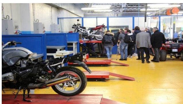
Ateliers maintenance motocycles au CFA de la CMA2