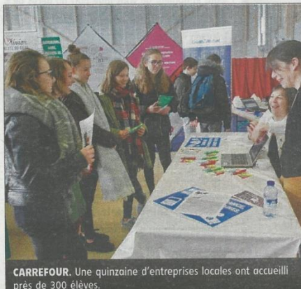
CARREFOUR. Une quinzaine d'entreprises locales ont accueilli près de 300 élèves.

Il se déroule une fois par an, toujours en partena-