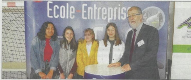
Le principal accompagné de quelques élèves.

Les 250 élèves des classes de 4 e des deux collèges se sont succédé, dans les stands. Un grand nombre