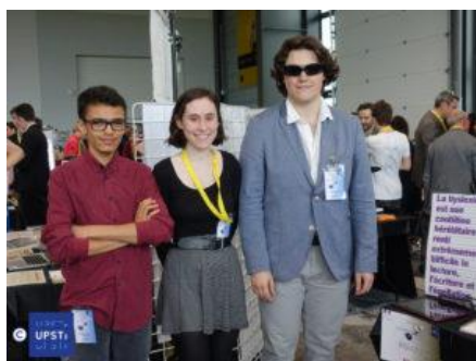
2 ème PRIX ( S-SI-Lycée Louis Armand – EAUBONNE Académie de Versailles ) : Dys-Glass Avec « Dys-Glass », les personnes dyslexiques retrouvent le goût pour la lecture.