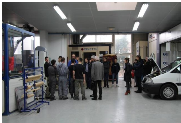
Atelier de carrosserie peinture au CFA de la CMA