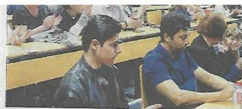
Les élèves accompagnés de leurs enseignants ont été mis à l'honneur.

Mardi à l'IUT d'Avignon a eu lieu la remise des prix du trophée AFDET84 (association française pour le développement de l'enseignement technique). Pour la 2 ème année, neuf établissements scolaires du département ont participé à ce challenge : les collèges Arausio et Jean-Giono à Orange, Anselme-Mathieu, Joseph Vernet et Tavan à Avignon et Jean-Henri-Fabre à Carpentras. Trois lycées ont également participé : Montesquieu à Sorgues et Vincent-de-Paul et Maria-Casarès à Avignon.