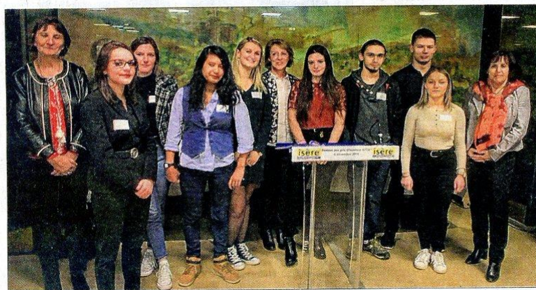
Issus de différentes filières, les jeunes ont vu leur travail récompensé.